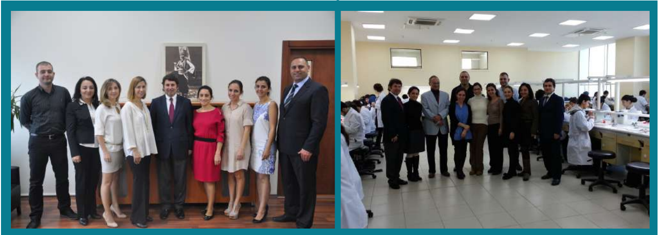
(Kuruluş Kadromuz 2012)